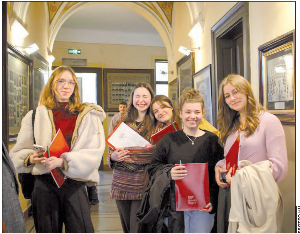
Nyílt nap a Kolozsvári Protestáns Teológiai Intézetben

Eddig is tudtam, hogy érettségi után lelkésznek tanulok