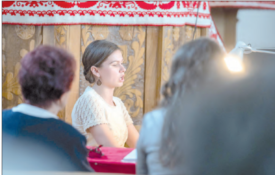
Tinédzserkora óta szolgál – itt éppen Harasztoson

– Mennyire ismerte gyerekkorában a zoltárokat, hogyan tekintett a gyülekezet kántorára?