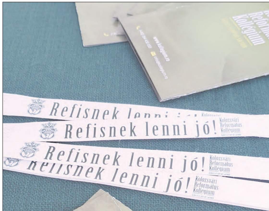
Április 6-án szervezik nyílt napjukat a Refi líceumi osztályai