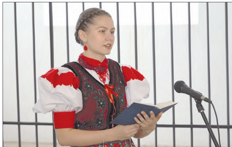
Az Egyházi énekkincsünk videósorozatban a zoltárokat népszerűsíti

– Természetesen. Nem tartoztam azon fiatalok közé, akik – mai kifejezéssel élve – „kikönfirmáltak” a gyülekezetből. Nagyon szerettem a gyülekezet kórusában énekelni, ezért hétről hétre rendszeresen jártam próbákra a szüleimmel együtt. Nagy élmény volt számomra, akárhányszor megkért a kántornő, hogy kísérem a kórust zongorán vagy orgonán. Általában