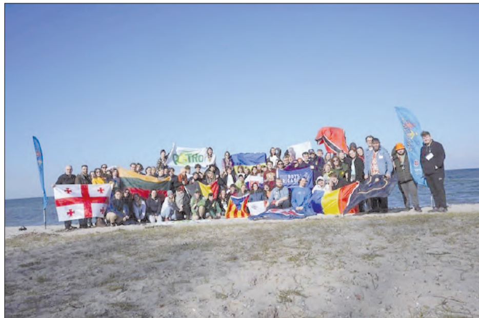
A tavalyi dániai vezetőképző csapata

vők. A csapat egy héten át fog olyan témákat boncolgatni, mint konfliktuskezelés, diplomácia, diszkrimináció és mentális egészség az európai ifjúság szemléletében. A különböző ifjúsági szövetségekből érkezők interaktív és izgalmas, kihívásokkal teli beszélgetéseknek és programnak néznek elébe. A szervezőcsapatnak áldásos munkát és együttlétet kívánunk! (H. E. T.)