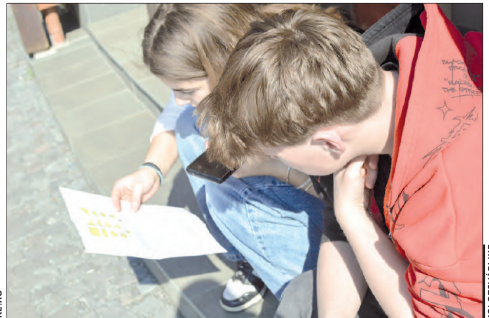
Száznál több konfirmandus a Dupla Kátén

badnapja). A hosszú múltra visszatekintő esemény tulajdonképpen alternatív kátéóra, amelynek célja – ha csak egy napra is – közös együttlétre invitálni az első- és másodéves konfirmandusokat. Az idei rendezvény a Mérföldkövek címet kapta, témája a református vallás, egyház kialakulása volt. A száznál is több konfirmandus stációról stációra, játékról játékra haladva bizonyíthatta ügyességét, kreativitását és a kátéórán szerzett tudását. (Hatházi Evelin Tímea)