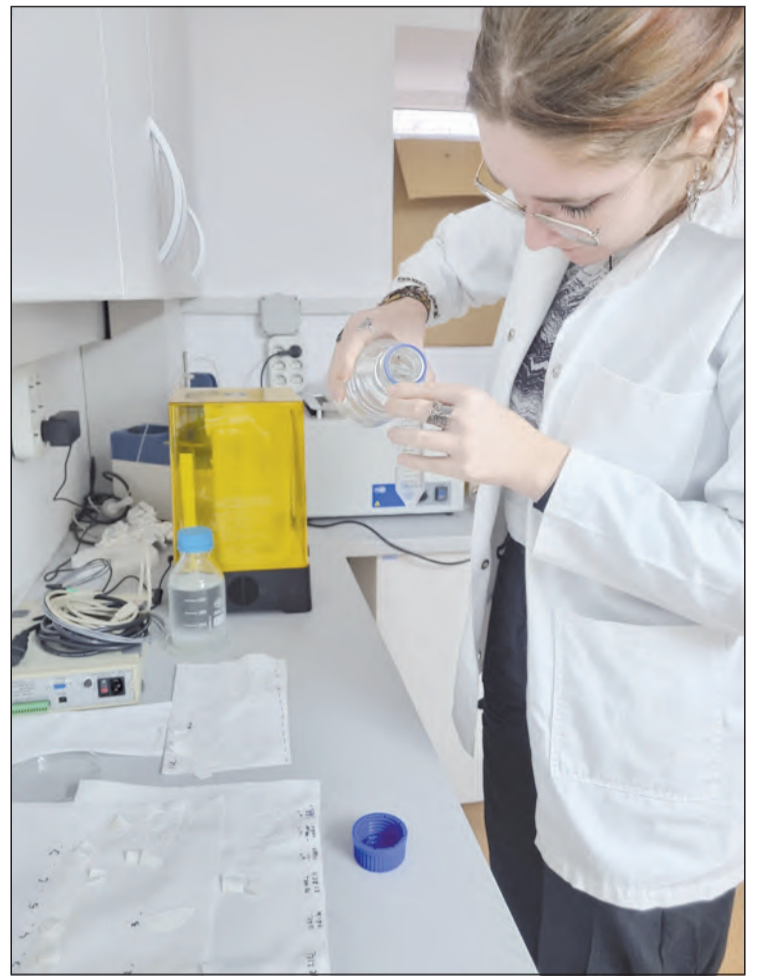
Szenzoruk kimutatja a moxifloxacin jelenlétét

– A kutatás célja az volt, hogy olyan szenzort készítsünk, amely képes kimutatni egy igen gyakori antibiotikum, a természetben is elterjedt moxifloxacin jelenlétét. Az emberi szervezetbe is könnyen bejutni képes moxifloxacin egyik fontos tulajdonsága, hogy ultravioleta fény hatására fluoreszkál, ez megkönnyíti a kimutatását. Ezt a szenzort végül papíralapra nyomtattuk, az egyetem által szolgáltatott 3D nyomtató segítségével – ismertetik kutatásukat a diákok. – Az így létrehozott szenzor sikeres alkalmazása kilátásba helyezi más antibiotikumok kimutatásának lehetőségét vízes közegből, és további kutatásokkal akár ezeknek a kivonását is. Az antibiotikumok egyre nagyobb problémát jelentenek, az ivóvizek is szennyezettek antibiotikummal, kimutatásuk egyre inkább előtérbe került, módszerünk pedig hozzájárul az emberi fogyasztásra szánt vizek antibiotikum-szennyezettségének kimutatásához. Léteznek erre a célra drága és kevésbé hatékony vizsgálatok, a mi módszerünk viszont olcsó, nagy mennyiségben, könnyen előállítható és alkalmazható – fejtették ki a fiatalok.