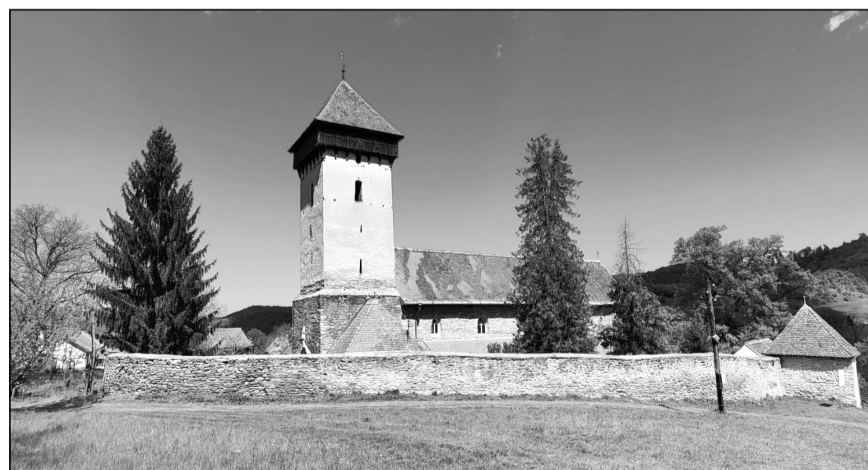
Az almakeréki evangélikus templom az egyik legjobb állapotban fennmaradt 14. századi gótikus falfestményt őrzi