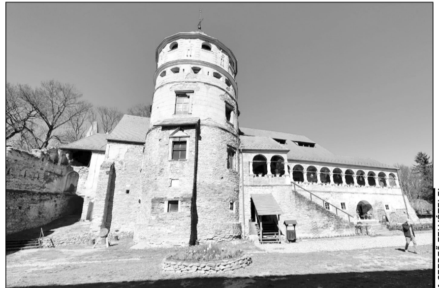
Az ikonikus keresdi Bethlen-kastély